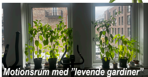
Motionsrum med "levende gardiner"

På Asta Lærkevejs øvre etager, er vi mange, der elsker chili'ens varme spark på tungen. Mange af borgerne har hjulpet til med at så frø, håndbestøve og vande. Inden længe kan vi høste frugterne af indsatsen!