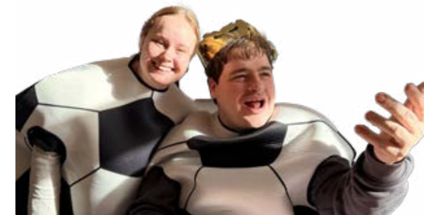
At være eller ikke at være - en fodbold...