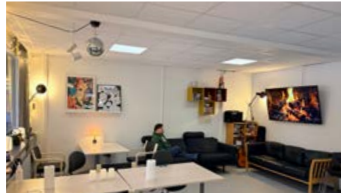
I Asta Rymarksvej er der i øjeblikket en opmærksomhed på at skabe stemning og hygge. Der er uddelt indretnings-ansvar for de enkelte rum, og der er blandt andet kommet små lamper og lyskæder både inde og ude, rispapirslamper i orgelhuset og planer om at indrette hyggekrege og farver på væggene flere steder.

Ingen af disse hensyn lægger op til en indretning, der er hverken sanselig eller stemningsfuld.