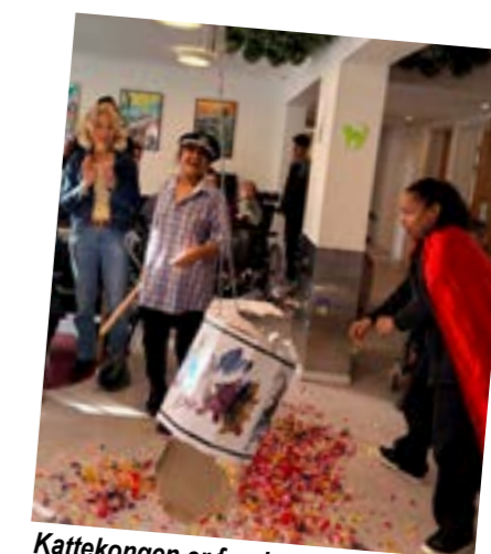
Kattekongen er fundet!