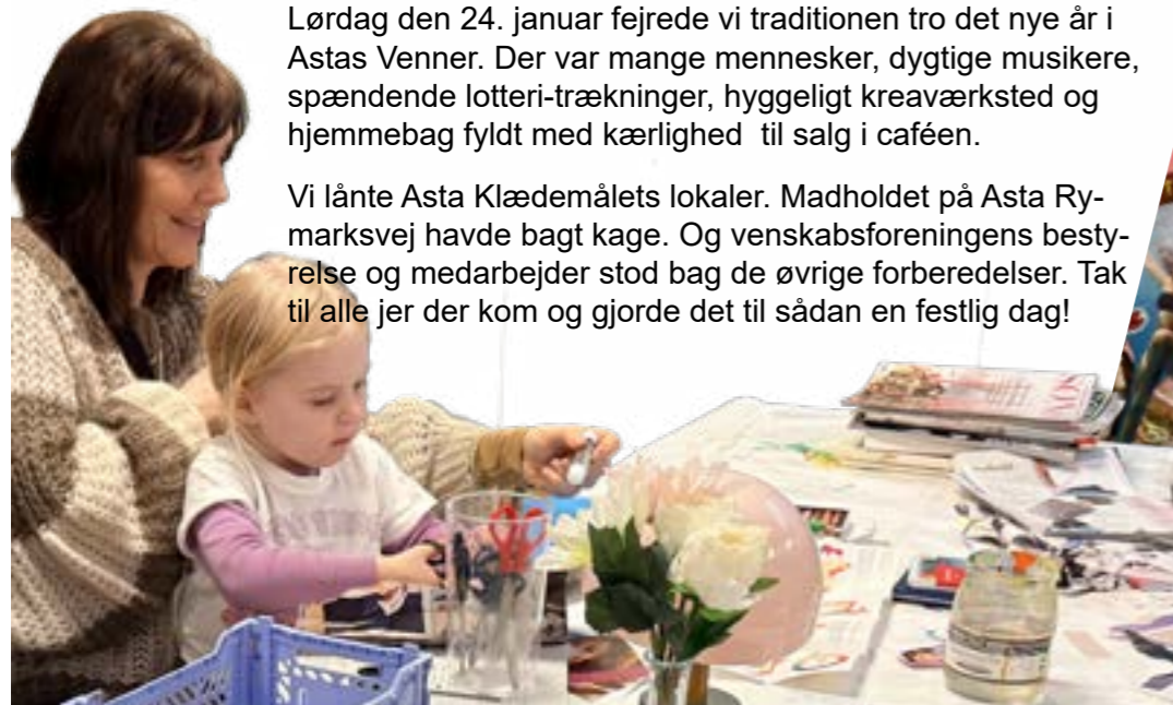
Mange var forbi Sveas krea-workshop og bidrage til farverige drømmeplakater - hvad drømmer vi om i 2026?

Vi lånte Asta Klædemålets lokaler. Madholdet på Asta Rymarksvej havde bagt kage. Og venskabsforeningens bestyrelse og medarbejder stod bag de øvrige forberedelser. Tak til alle jer der kom og gjorde det til sådan en festlig dag!