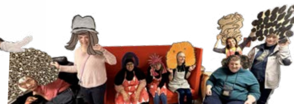
Kreaholdet på Rymarksvej i flotte fastelavns-paryk-kreationer!