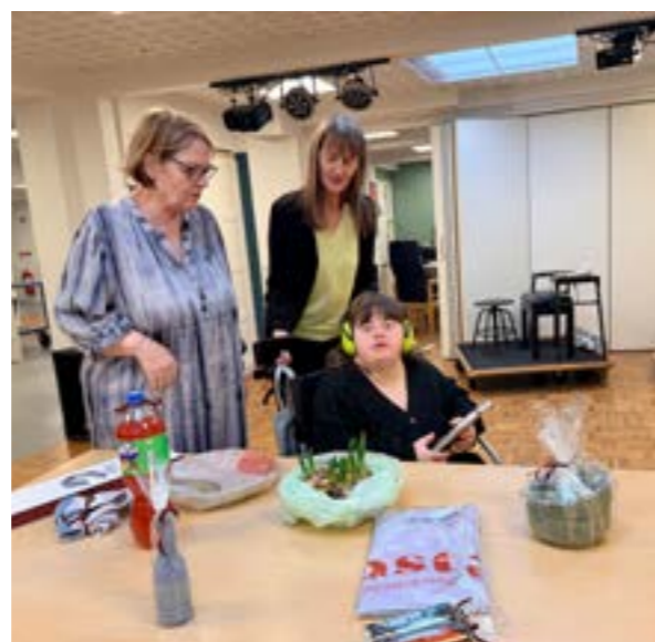
Lotterilodderne gik som varmt brød. Det er altid spændende, når den røde tromle ruller...