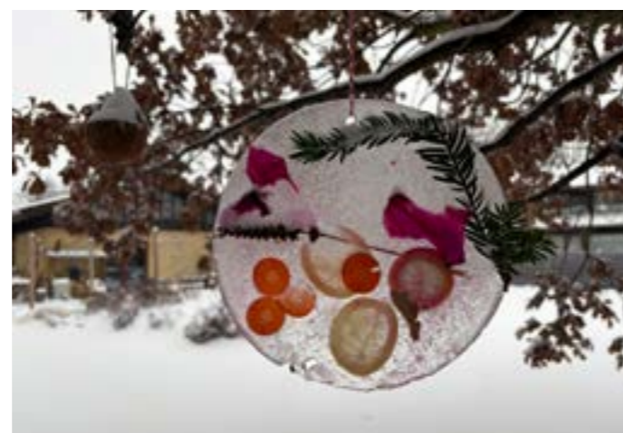
De smukke is-frugt-dekorationer, der prydede træerne og fangede vinterlyset på Rymarksvejs bålplads er smeltet for forårssolen.

Vinteren kunne bestemt også noget. I dette blad kan du se billeder fra et par af årstidens fester – fastelavn på Lærkevej og Rymarksvej og Astas Venners nytårskur i Asta Klædemålet.