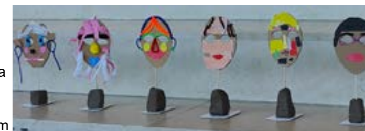
blandt de udstillede værker ved sidste års afslutning var en række flotte selvportrætter.

Projektet sker i samarbejde med Statens Museum for Kunst, foreningen Venner af Captum, ni frivillige samt fire kommunale bo- og aktivitetstilbud. Fra Asta Fonden deltager Lærkevej og Rymarksvej.