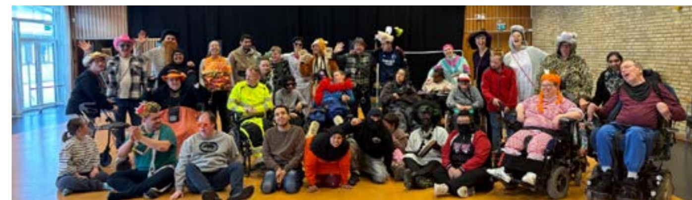
Kan du gætte, hvem vi er?

Næsten hver onsdag cykler denne karavane med 5 faste cykelpiloter og op til 8 passagerer ud i det blå. Turene tilpasses i længde, og efter årstiden skruer vi op og ned for varmedunke, uldhuer og tæpper. Vi aflyser, hvis det øser ned, men det er yderst sjældent, at vi holder længere pauser i cykelturene. Det blev nødvendigt et par uger i februar - og NU tager vi revanche.