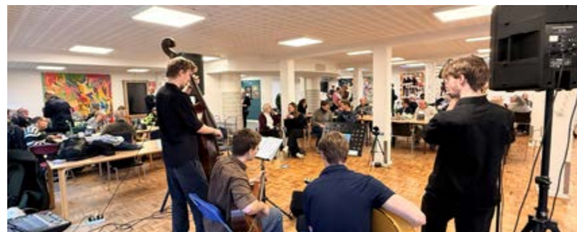
Gypsy jazz-bandet Djangostik bestod af fire unge musikere, der tydeligvis var gode venner med deres instrumenter og hinanden.